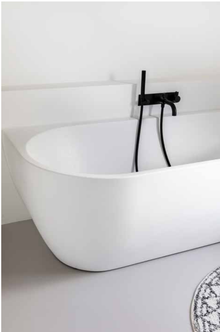
Het bad is van Wiesbaden, de zwarte kranen van Hotbath.