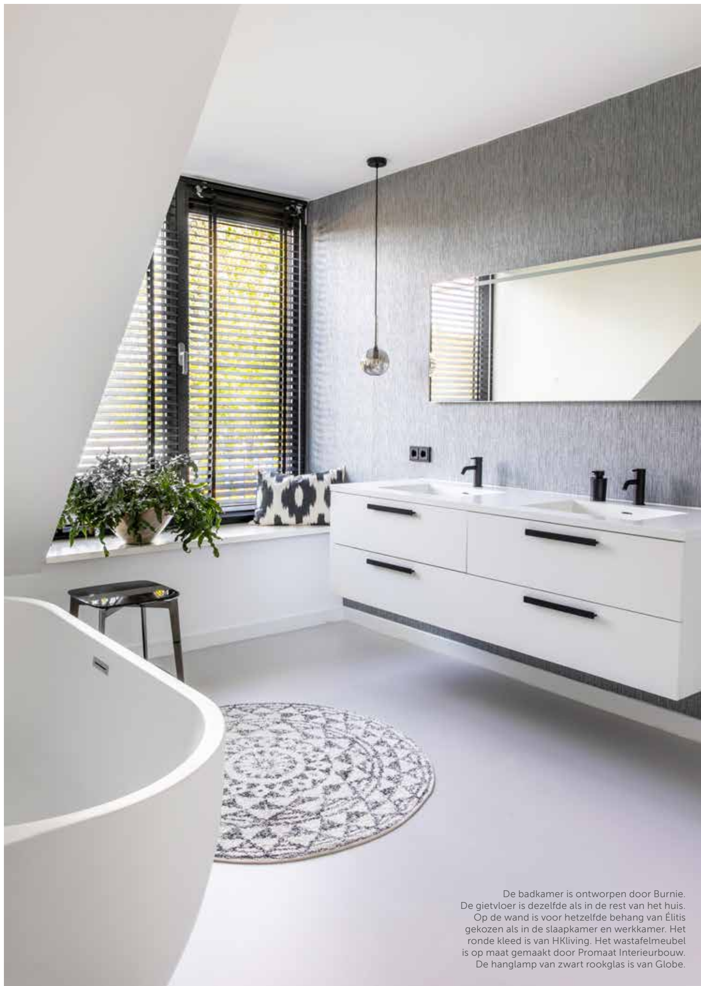
De badkamer is ontworpen door Burnie. De gietvloer is dezelfde als in de rest van het huis. Op de wand is voor hetzelfde behang van Élitis gekozen als in de slaapkamer en werkkamer. Het ronde kleed is van HKliving. Het wastafelmeubel is op maat gemaakt door Promaat Interieurbouw. De hanglamp van zwart rookglas is van Globe.